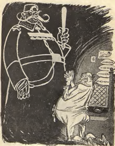
Рис. Н. Ре-ми.